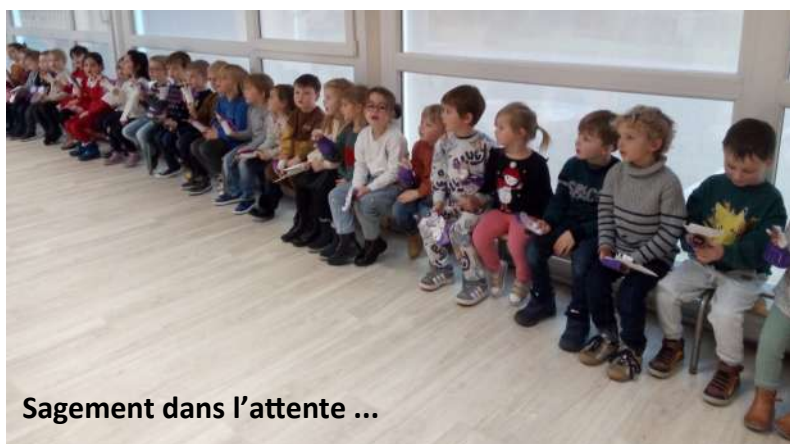
Sagement dans l'attente ...