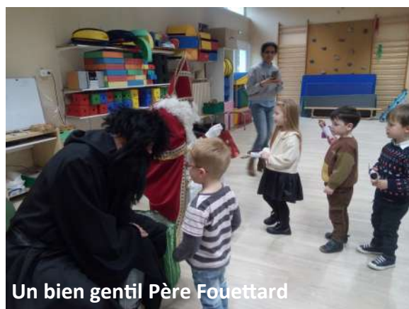
Un bien gentil Père Fouettard